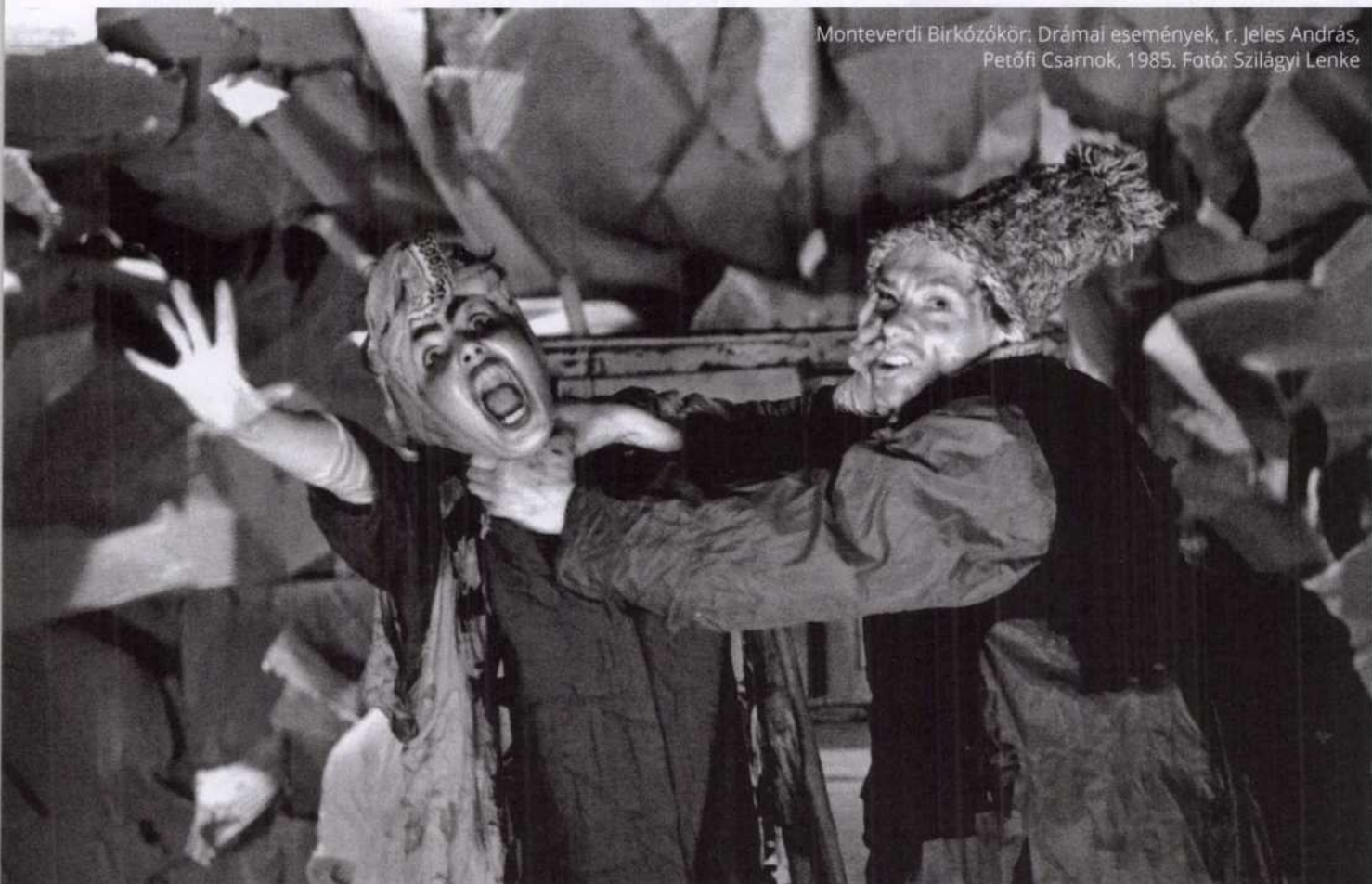
Monteverdi Birkózókör: Drámai események, r. Jeles András, Petőfi Csarnok, 1985.

„Mi az ember?” – voltaképp ezt kutatta az előadás. A létezés tragikus abszurditásának ábrázolása egyszerre volt megdöbbentő, végtelenül szomorú és harsányan komikus. A nézők végig nevettek a szedett-vedett jelmezeket viselő furcsa lények esetlenségén és tétova botladozásain, miközben azt érezték, hogy valami fordulat felé mégiscsak tart az előadás. Ezt a feszült várakozást pedig visszaigazolta a nagyjelenet, mely azt tanúsította, hogy még a legmélyebbre süllyedt ember is képes felemelni a tekintetét: a váratlanul megjelenő csoda, a transz-